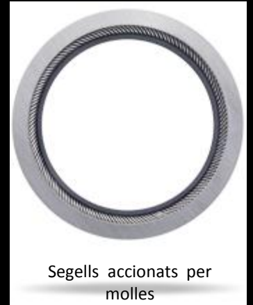
Segells accionats per molles