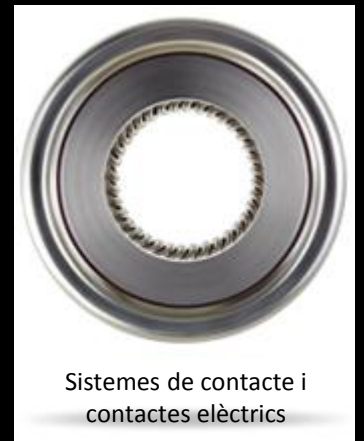
Sistemes de contacte i contactes elèctrics